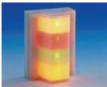
Blikající signalizační světlo a zabudovaná akustická signalizace upozorňují osoby v okolí na nouzovou situaci v prostoru WC.